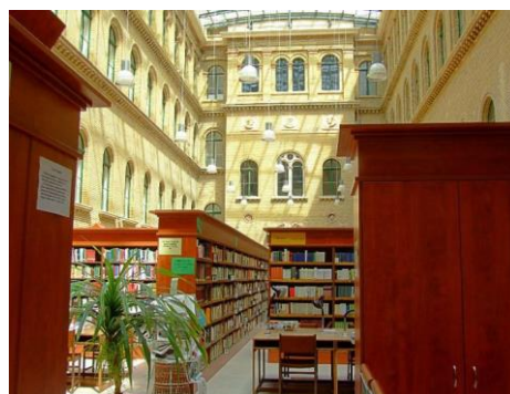
A könyvtári olvasóterem