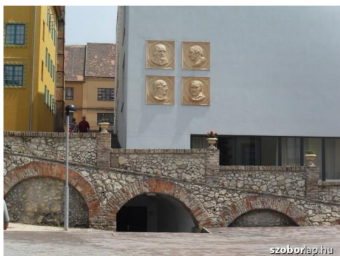
A könyvtárat díszítő domborművek a pécsi Zsolnay Kulturális Negyedben

A külső és belső homlokzat díszítőelemei a pécsi Zsolnay-gyár munkái. A korábban nyitott belső udvart 2006-ban kezdték el - a műemléki követelmények figyelembevételével - könyvtári célra beépíteni. A két önálló intézeti könyvtár 2007 óta működik ezen az impozáns helyen.